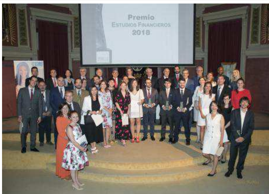
Foto de familia de los premiados (Redacción: María Guijarro)